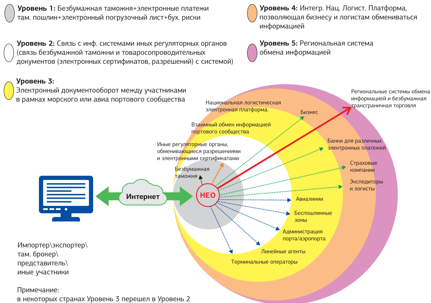
Рис. 4. Пять последовательных стадий внедрения Единого Окна. 225

Некоторые страны Западной Африки решили внедрить Единое Окно на уровне портов в качестве первоочередной задачи. За исключением Ганы, обладающей наиболее продвинутой системой в регионе, все эти порты с их программами Единого Окна находятся на очень ранней, и не исследованной, стадии. Также остается непонятной позиция таможенных органов в отношении Единого Окна.